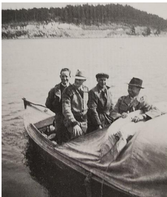
Fra Lindön med kurerer til Hvaler/Fredrikstad